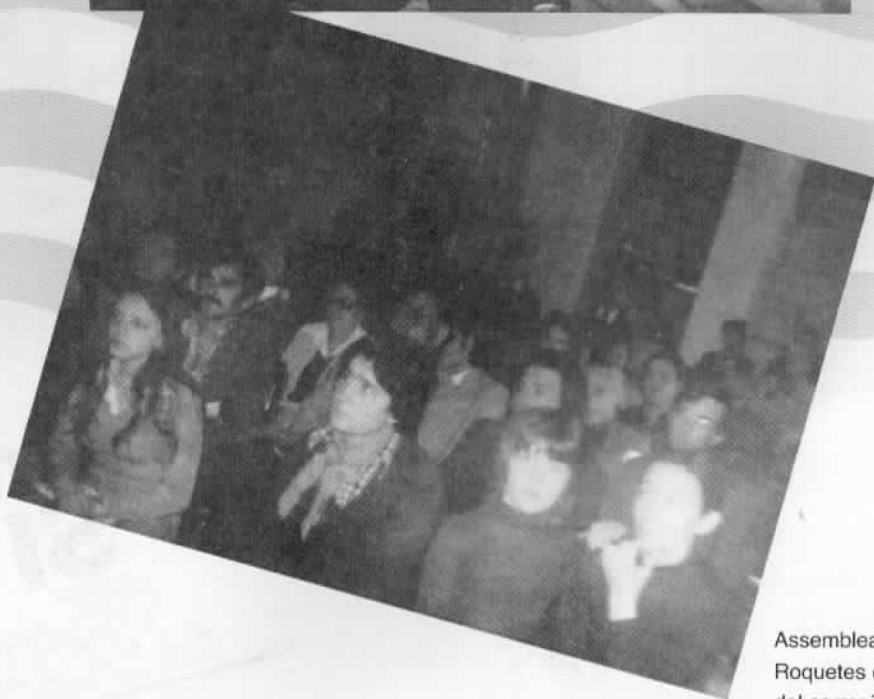
Assemblea democràtica a les Roquetes celebrada a un local del carrer Torres Quevedo. 1976