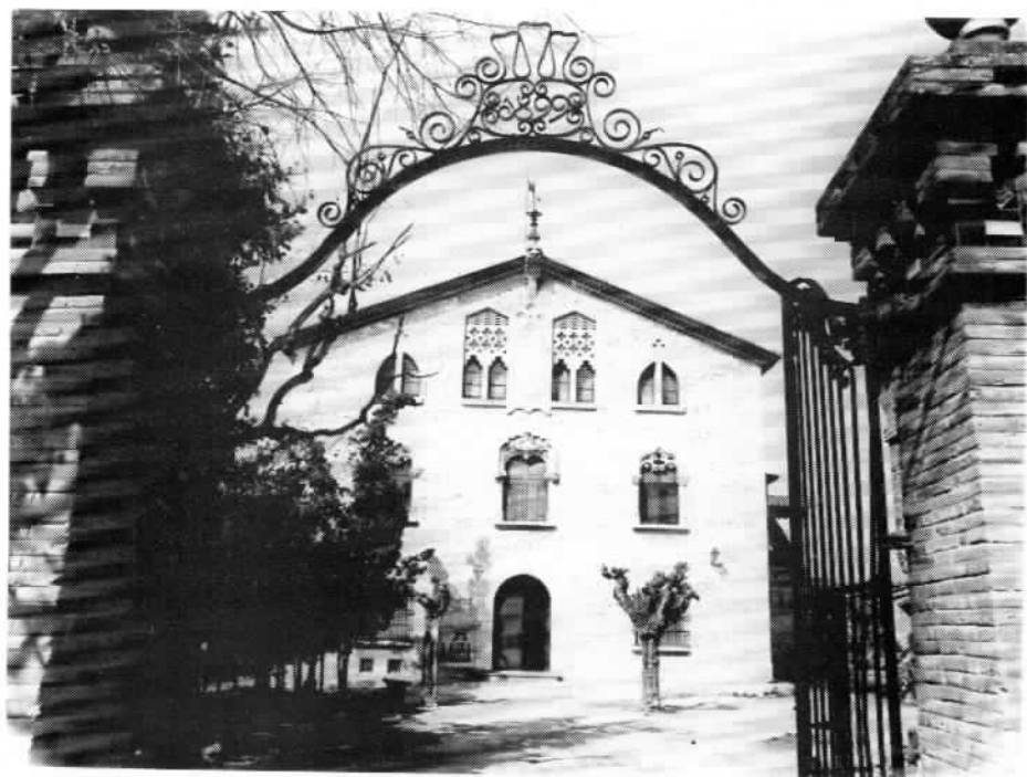
CAN MIRET DE LES TORRES