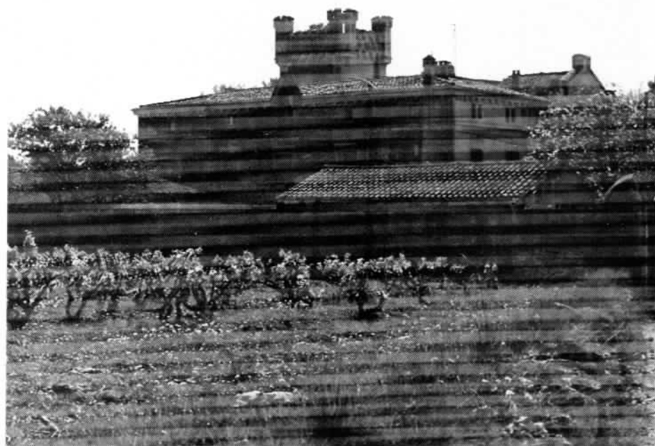
TORRE DEL VEGUER